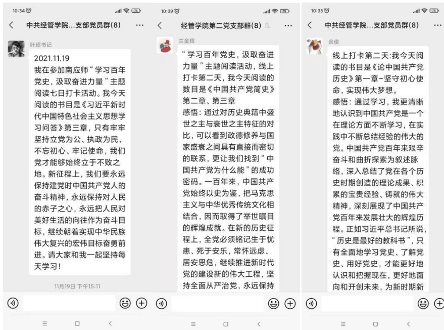
(经济与管理学院第二党支部部分师生党员阅读党史读本学习心得打卡)